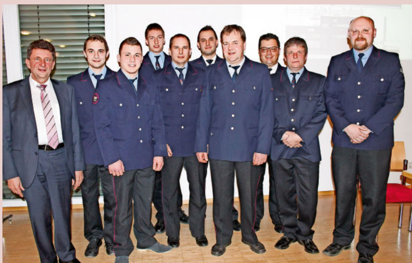
Die Freiwillige Feuerwehr Burgrieden: auch personell vereinigt.